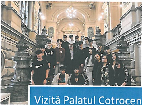
Vizită Palatul Cotroceni