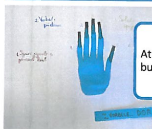
Proiectul Mere sănătoase inimi nezdobite