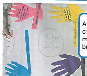
Proiectul Mere sănătoase inimi nezdobite